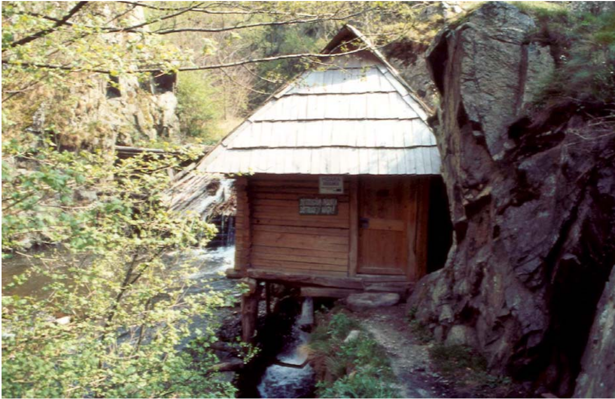
2) Vue d'ensemble d'un moulin