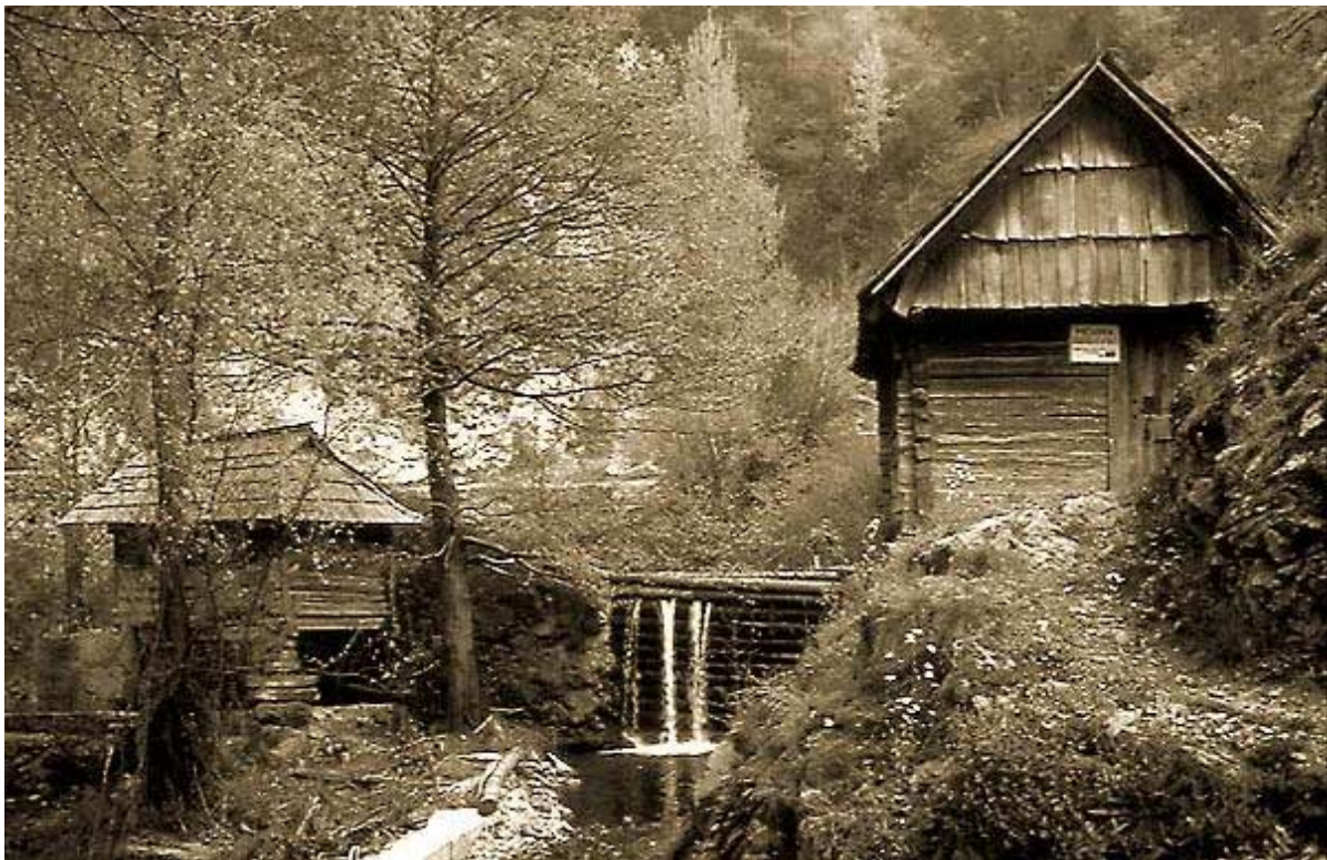
3) Vue du bâtiment d'un moulin